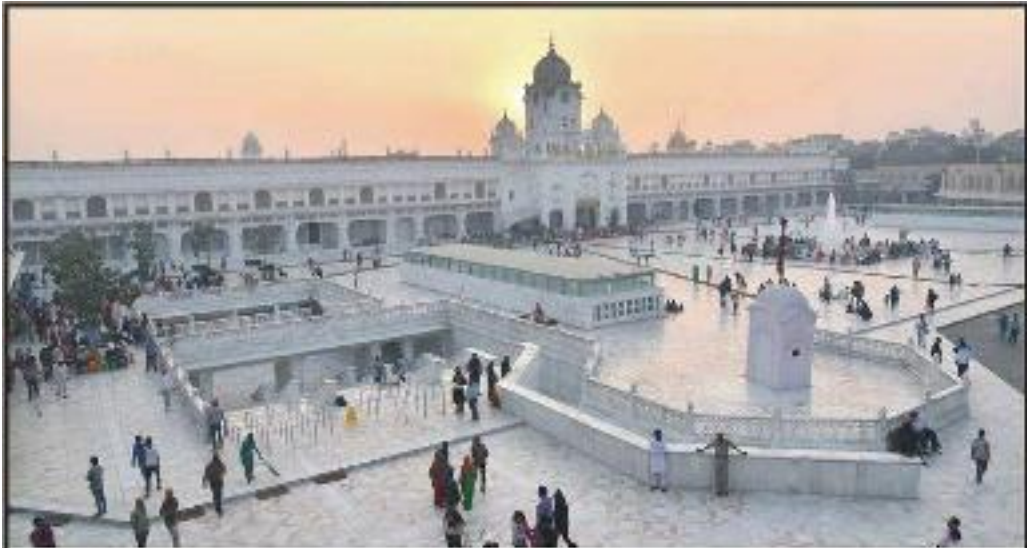
ਸੱਚਖੰਡ ਸ੍ਰੀ ਹਰਿਮੰਦਰ ਸਾਹਿਬ ਦੇ ਛਾਹਰ ਘੰਟਾ ਘਰ ਠਾਹੀ ਵਿਖੇ ਸਣੇ ਪਲਾਜਾ ਦਾ ਖੂਬਸੂਰਤ ਦ੍ਰਿਸ਼।